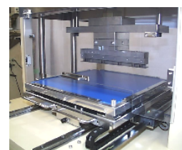
ワークテーブル及びカッターユニット

低荷重での裁断が可能のため装置自体も コンパクト 。生産ラインから実験室レベルまで、幅広くご使用頂けます。